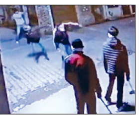
अंबाला। सीसीटीवी कैमरे में कैद हुए आरोपी व मौके से मिला कारतूस का खोला।