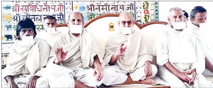
पानीपत। जैन मुनिगण प्रवचन करते हुए।