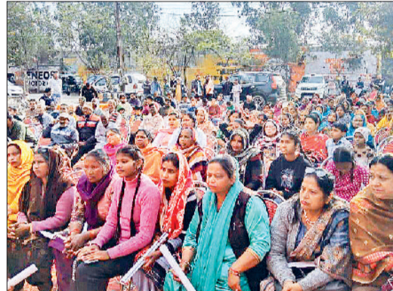
अंबाला। निर्माण कार्य का शिलान्यास करते विधायक व मौजूद लोग।

विकास कार्यों के निर्माण कार्य का शिलान्यास किया गया। इसमें सड़कें, बरसाती पानी की निकासी के लिए पाइपलाइन डालने का काम भी शामिल है। विधायक ने इस मौके पर कहा कि आपने अपनी वोट की ताकत से मनोहर व केंद्र में मोदी सरकार बनाई। आपके वोट की ताकत से नरेंद्र मोदी ने भारत को विकसित राष्ट्र बनाने के लिए रोटी, कपड़ा और मकान के अलावा स्वास्थ्य और पढ़ाई की गारंटी देते हुए 80 करोड़ लोगों को मुफ्त नरेंद्र मोदी ने आयुष्मान कार्ड/चिरायु कार्ड के माध्यम से लोगों को 5 लाख रूपए के मुफ्त