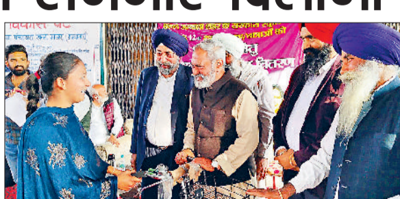
अंबाला। स्कूली छात्रों को साइकिलें बांटे पूर्व मंत्री विनोद शर्मा।

पूर्व केंद्रीय मंत्री विनोद शर्मा ने कहा कि अंबाला में हर घर रोजगार दिलाना उनकी प्राथमिकता है। यह तभी संभव हो पाएगा, जब यहां आईएमटी स्थापित होगी। यह सपना भी सच हो जाएगा। शर्मा ने कहा कि यदि आप लोगों का साथ मिला तो आईएमटी लगवाकर रहेंगे। युवाओं को रोजगार मिल पाएगा। उन्होंने