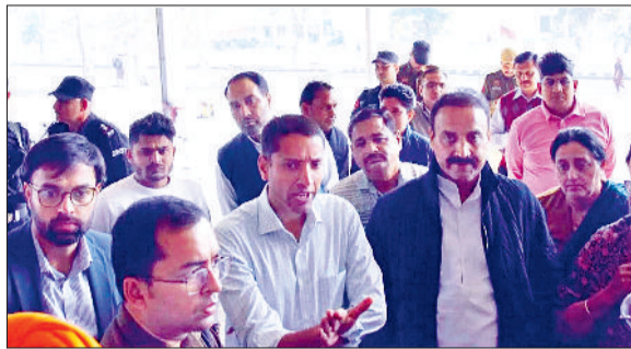
करनाल। नई अनाज मंडी में आयोजित होने वाले कार्यक्रम को लेकर जायजा लेने पहुंचे डीसी व अन्य।