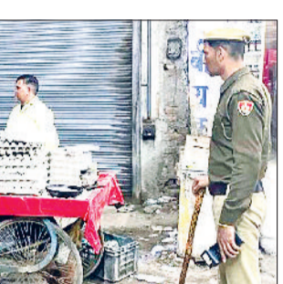
शराब ठेके के पास रेहड़ी संचालक को चेतावनी देते हुए पुलिस टीम।

पानीपत। जिला विकास समन्वय एवं निगरानी कमेटी की बैठक सोमवार को जिला सचिवालय के प्रथम तल पर स्थित सभागार में उपायुक्त डॉ. वीरेन्द्र दहिया की उपस्थिति में संपन्न हुई। बैठक में उपायुक्त ने सांसद कोष से कराये जा रहे विकास कार्यों की खर्च राशि का ब्यौरा लिया और पिछली बैठक के दौरान शेष बचे कार्यों की समीक्षा की तथा वर्तमान समय में केन्द्र सरकार द्वारा संचालित की जा रही महत्वाकांक्षी योजनाओं की प्रगति को अधिकारियों से जाना उपायुक्त ने अधिकारियों से सम्बंधित विभागों में संचालित की जा रही योजनाओं की वर्तमान में क्या स्थिति है, कितना कार्य बचता है पर चर्चा की और कुछ जरूरी दिशा निर्देश दिए।