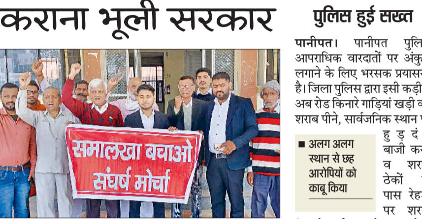
पानीपत। समालखा बचाओ संघर्ष मोर्चा के पदाधिकारीगण प्रदर्शन करते हुए।