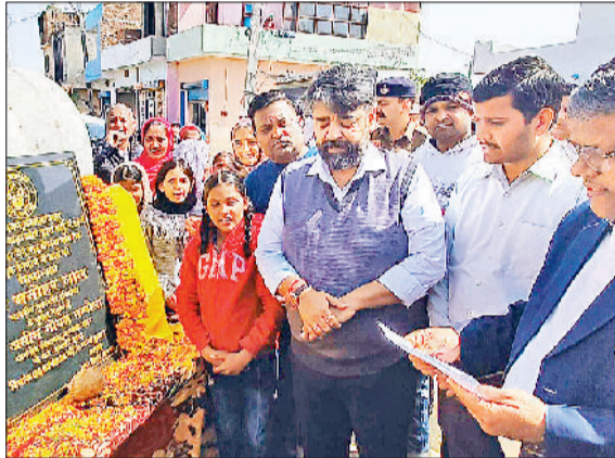
अंबाला। निर्माण कार्य का शिलान्यास करते विधायक व मौजूद लोग।

अंबाला शहर के विधायक असीम गोयल नन्हीला ने सोमवार को वार्ड नंबर -5, 11 व 12 में 1 करोड़ 68 लाख रूपए की लागत से किए जाने वाले विकास कार्यों का शिलान्यास किया। सभी वार्डों में लोगों ने विधायक को फूलमालाएं पहनाकर अभिनंदन किया। विधायक असीम गोयल ने कहा कि इन विकास कार्यों के होने से वार्डों की सुंदरता बढ़ेगी। उन्होंने यह भी कहा कि पहले भी इन वार्डों में विकास कार्यों को करवाने का काम किया गया है। विधायक ने विकास कार्यों के शिलान्यास के तहत वार्ड नंबर-11 में रणजीत नगर मैन रोड से नया गांव तक 38.71 लाख रूपए की लागत से बनाई जाने वाली सड़क के निर्माण कार्य का शिलान्यास किया। इसी वार्ड में मोती नगर में 4.69