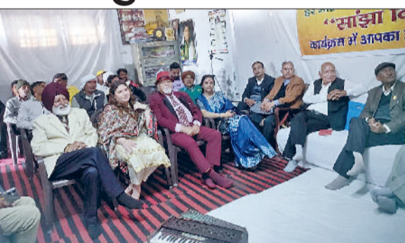
करनाल। विकास क्लब भवन में आयोजित मासिक सांझा विरासत कार्यक्रम में उपस्थित रचनाकार।