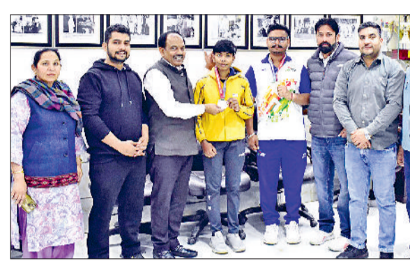
खेलो इंडिया यूनिवर्सिटी गेम्स में आर्य कॉलेज ने शूटिंग में जीता गोल्ड