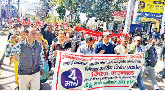
ऑनलाइन हाजिरी के निर्णय के खिलाफ ग्रामीण सफाईकर्मियों, ग्रामीण चौकीदार व ट्यूबवेल ऑपरेटर्स प्रदर्शन करते हुए।