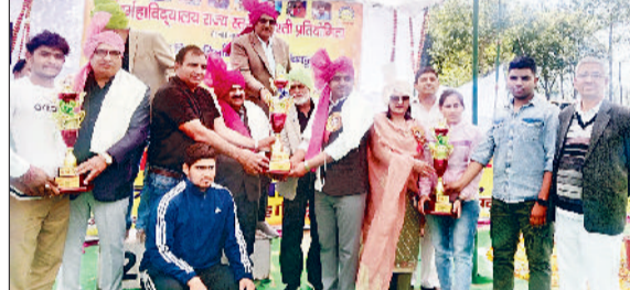
इसराना। राजकीय कॉलेज इसराना में विजेता खिलाड़ियों को पुरस्कृत करते हुए अतिथिगण।